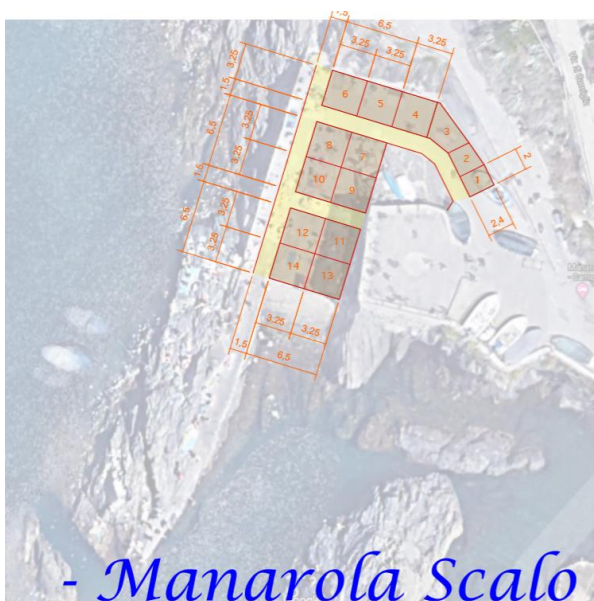
- Manarola Scalo