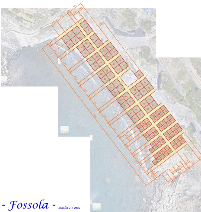
- Fossola - scala 1 : 200

Abbiamo individuato tre aree nelle quali ci saranno spazi delimitati (Fossola, scalo Manarola e Palaedo) come da planimetria allegata, tutte le aree non delimitate si intendono libere.